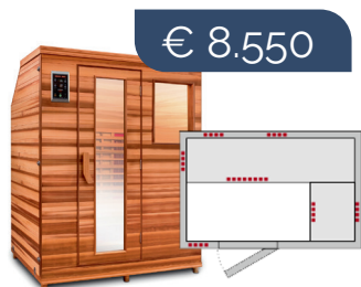
HM-LSE-3 BT met schuin dak